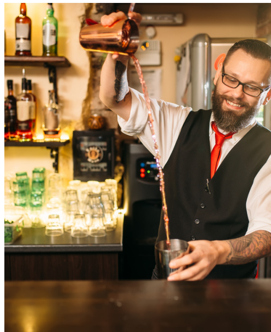
BLANKET LADDER $40 Organize your living room.