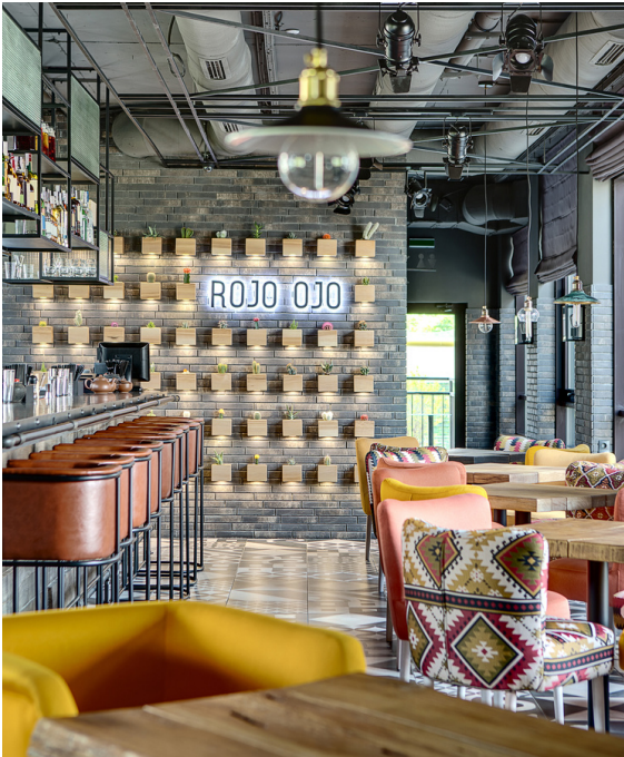
LAMP $50 Versatile and trendy.

Πιείτε, φάτε & διασκεδάστε στα μαγαζιά μας