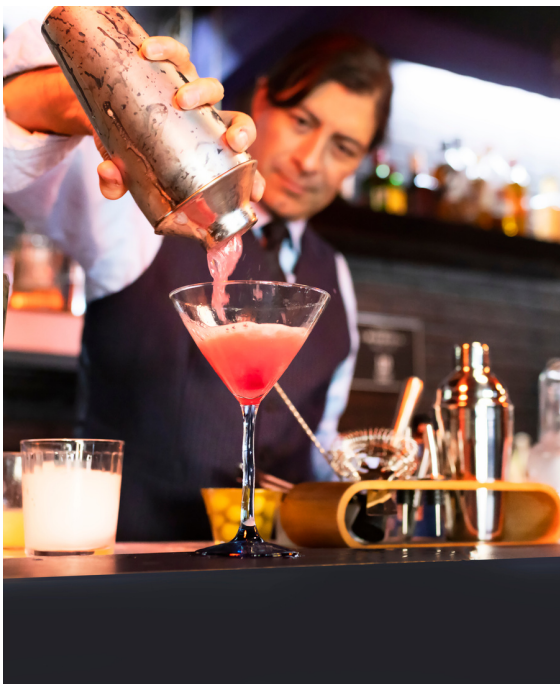
PLANTS $25 Beautify your work space.