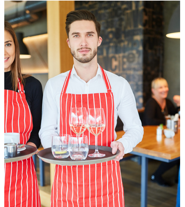
COFFEE TABLE $75 Versatile coffee table.