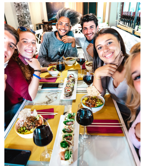
SCENTED CANDLE $12 Make your home smell nice.