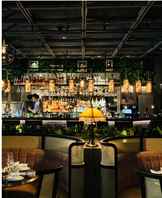
TABLE $200 Beautiful table for your kitchen.