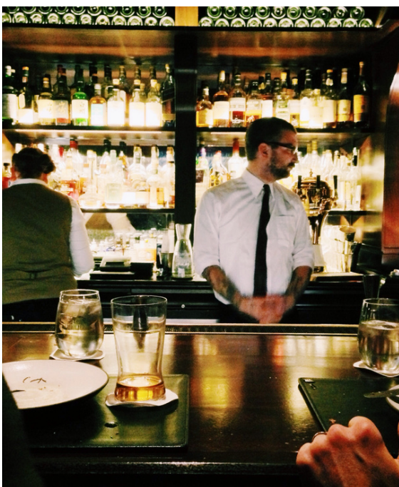
PLANTS $25 Beautify your work space.