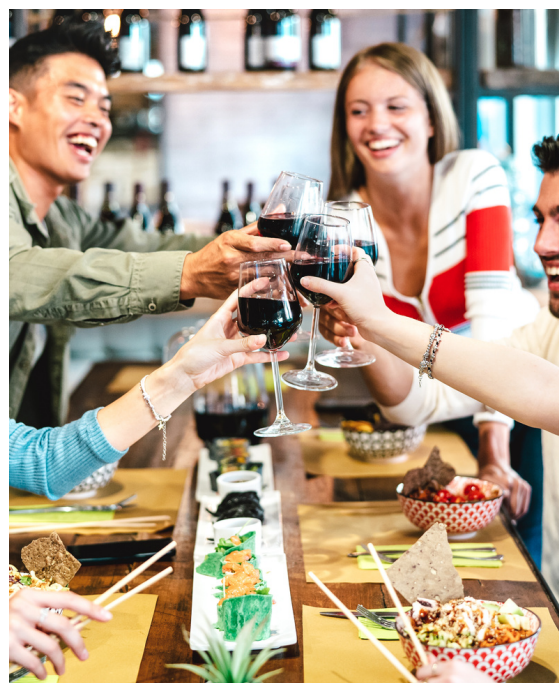
BLANKET LADDER $40 Organize your living room.