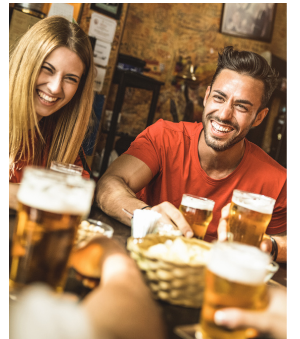
SCENTED CANDLE $12 Make your home smell nice.